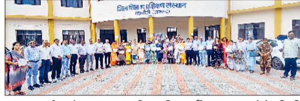
झज्जर। कार्यक्रम के समापन पर उपस्थित प्रशिक्षणार्थी।