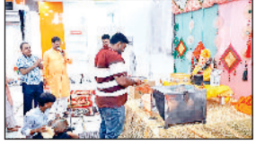
झज्जर। काशीगिरी मंदिर में बाबा गणेश की आरती करते हुए श्रद्धालु।