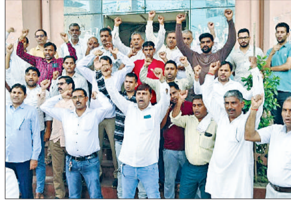
बहादुरगढ़। नारेबाजी करते प्रदर्शनकारी बिजली कर्मचारी।