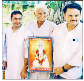
बहादुरगढ़। विधायक का स्वागत करते ग्रामीण।