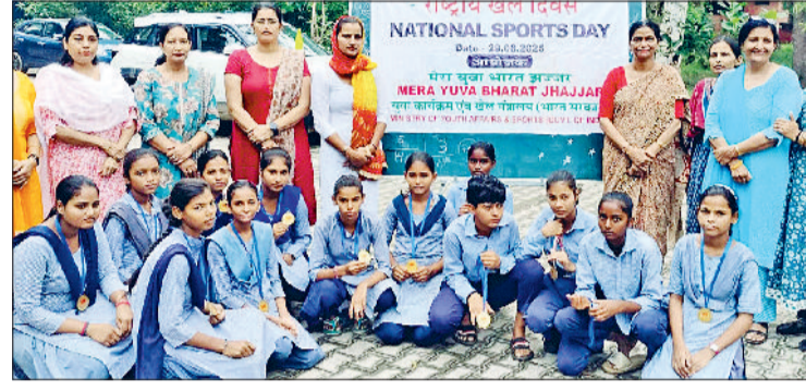
बहादुरगढ़। शिक्षकों के साथ पदक जीतने वाले बच्चे।