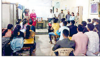
झज्जर। कार्यक्रम में उपस्थित विद्यार्थी एवं शिक्षक।