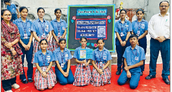
बहादुरगढ़। शिक्षकों के साथ कार्यक्रम में भाग लेने वाले बच्चे।