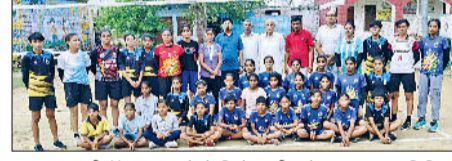
झज्जर। वॉलीबाल मुकाबले में विजेता टीम के साथ मुख्यातिथि।