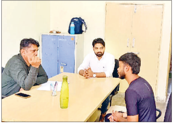
झज्जर। जाँब मेले में विद्यार्थियों का साक्षात्कार लेते हुए कंपनी प्रतिनिधि।

हरिभूमि न्यूज झज्जर राजकीय औद्योगिक प्रशिक्षण संस्थान साल्हावास में शुक्रवार को जाँब मेले का आयोजन किया गया। जिसमें जिले के विभिन्न औद्योगिक प्रतिष्ठानों के विद्यार्थियों ने भाग लिया। जाँब मेले में क्षेत्र की नामी कंपनियों के प्रतिनिधियों ने साक्षात्कार के आधार पर विभिन्न व्यावसायिक पदों पर रोजगार व