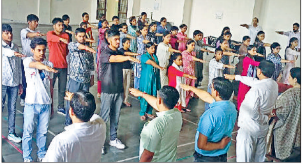
बहादुरगढ़। खेल भावना की शपथ लेते छात्र।