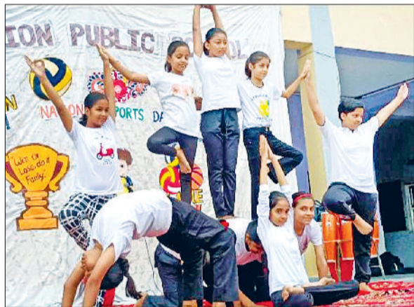
बहादुरगढ़। कार्यक्रम के दौरान योग प्रदर्शन करते विद्यार्थी।