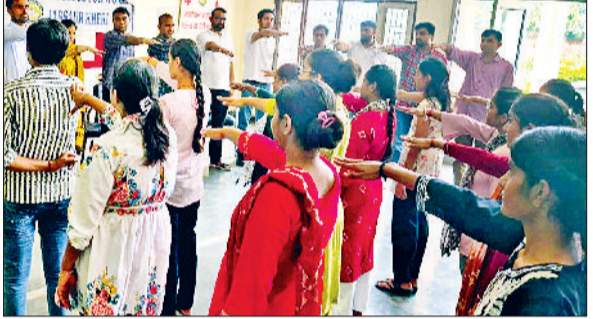
बहादुरगढ़। कार्यक्रम में शपथ लेती छात्राएं।