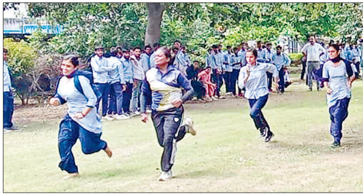
बहादुरगढ़। दौड़ लगाती छात्राएं।